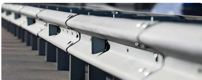
Барьерное ограждение Мостовое/Дорожное