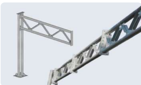
Опоры рамные РМП/РМГ